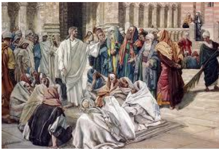
Pharisees Question Jesus by James Tissot

Lúc Người lìa dân chúng mà về nhà, các môn đệ hỏi Người về ý nghĩa dụ ngôn ấy. Người liền bảo các ông: "Các con cũng mê muội như thế ư? Các con không hiểu rằng tất cả những gì từ bên ngoài vào trong con người không thể làm cho người ta ra ô uế được, vì những cái đó không vào trong tâm trí, nhưng vào bụng rồi xuất ra". Như vậy Người tuyên bố mọi của ăn đều sạch. Người lại phán: "Những gì ở trong người ta mà ra, đó là cái làm cho người ta ô uế. Vì từ bên trong, từ tâm trí người ta xuất phát những tư tưởng xấu, ngoại tình, dâm ô, giết người, trộm cắp, tham lam, độc ác, xảo trá, lăng loàn, ganh tị, vu khống, kiêu căng, ngông cuồng. Tất cả những sự xấu đó đều ở trong mà ra, và làm cho người ta ra ô uế".